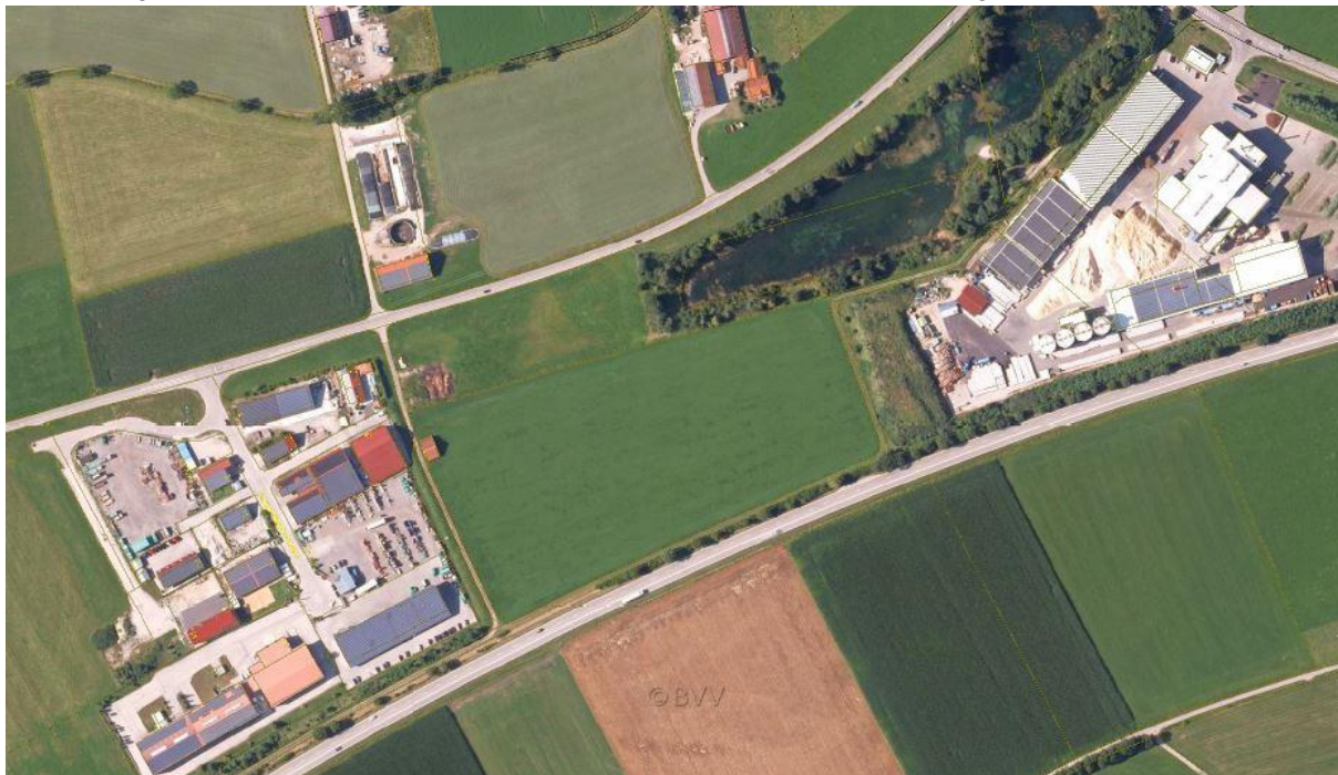
Abb. 2 Digitales Orthophoto, ohne Maßstab

Der Geltungsbereich 2 wird aktuell und bisher ebenfalls intensiv landwirtschaftlich genutzt.